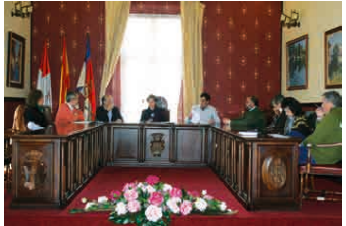
Reunión con profesionales.

El pasado día 3 de Mayo de 2012 , el Pleno del Consejo General del Poder Judicial , aprobó las bases para una nueva demarcación judicial enmarcada en la reforma de la Ley de Demarcación y Planta Judicial, en las que se plantea la supresión del Partido Judicial de Villarcayo entre cientos de ellos en toda España. Y en nuestro caso, integrarnos en el de Miranda de Ebro.