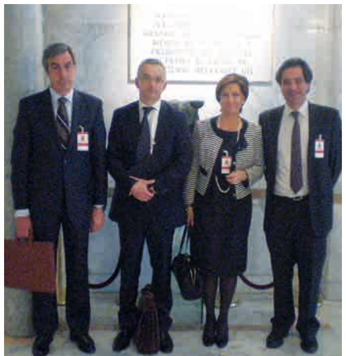
Madrid. Sede del Consejo General del Poder Judicial.

Con todo ello , intentamos que los responsables políticos y judiciales , conozcan la realidad de nuestro Partido Judicial , nuestras características propias y que tanto el Informe del Tribunal Superior de Justicia de Castilla y León, del que se está a la espera, como el propio Ministerio que ha de elaborar esta Ley , como el Congreso de los Diputados y el Senado que han de aprobarla , consideren como nosotros , con razones objetivas y reales , que el Partido Judicial de Villarcayo ha de permanecer , eso sí , adaptado al nuevo modelo que resulte de este largo proceso que se dilatará al menos dos años .