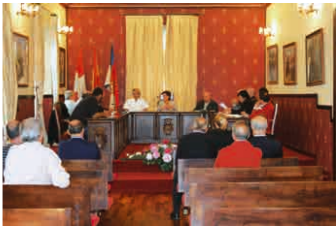
Reunión con alcaldes.

Desde el momento que tuvimos conocimiento de este informe , el Ayuntamiento de Villarcayo , comenzó a realizar gestiones de todo tipo para mostrar su absoluta disconformidad y su oposición a lo indicado en dicho informe con el apoyo del resto de Ayuntamientos de los municipios de Merindades y de todos los profesionales dedicados a la Justicia que ejercen en la Comarca.