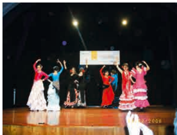
Grupo de Sevillanas.