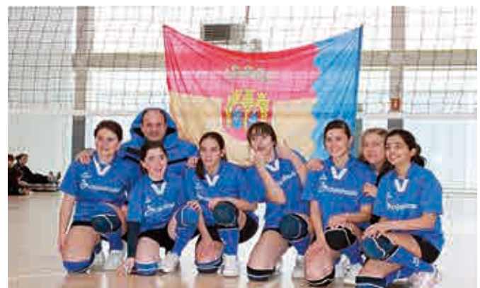
Foto Finales provinciales. Polideportivo Esther San Miguel Burgos.

Estas chicas prometen larga carrera deportiva ya que compaginan perfectamente la diversión con el entrenamiento.