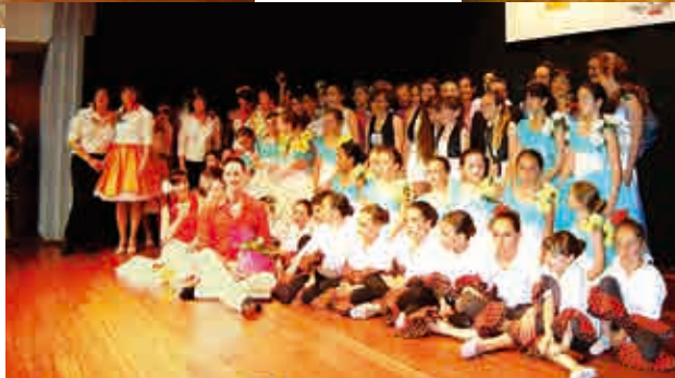
Escuela Municipal de Danza.