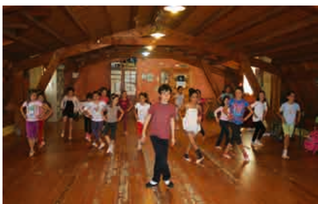
Ensayo de las clases de Danza Moderna.