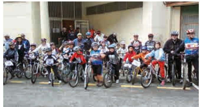
Foto de la salida de los corredores desde el polideportivo de Villarcayo 19 de Mayo 2012.

Agradecer a Cruz roja y a protección Civil Villarcayo que velaron por la seguridad de tod@s los par