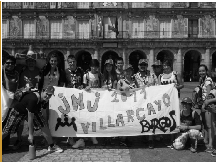
Algunos de los jóvenes de Villarcayo que participaron en el encuentro

Los cielos estarán despejados o parcialmente cubiertos. No se esperan precipitaciones. Temperatura mínima sin cambios, y máxima en ascenso, con mínima de 9.5°C y máxima de 32.2°C. Viento en calma.